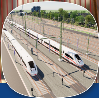
Neubau Abstellung Hamburg