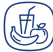
Obst und Getränke frei