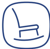
Anerkennung zum Ruhestand

Werden Sie Teil unseres Teams und profitieren Sie von unseren zahlreichen Benefits!