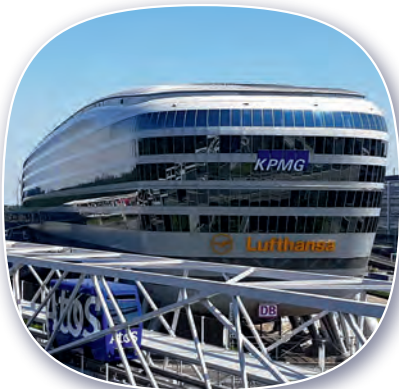
HOCHBAU & ARCHITEKTUR