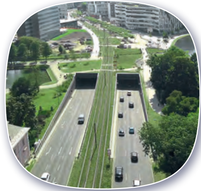
WASSER & UMWELT